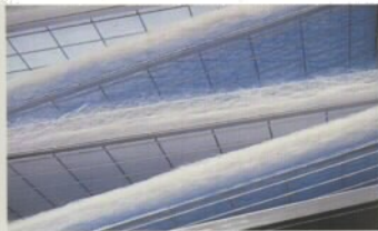
Umweltfreundlich und schnell gewechselt: Die Filtermatten