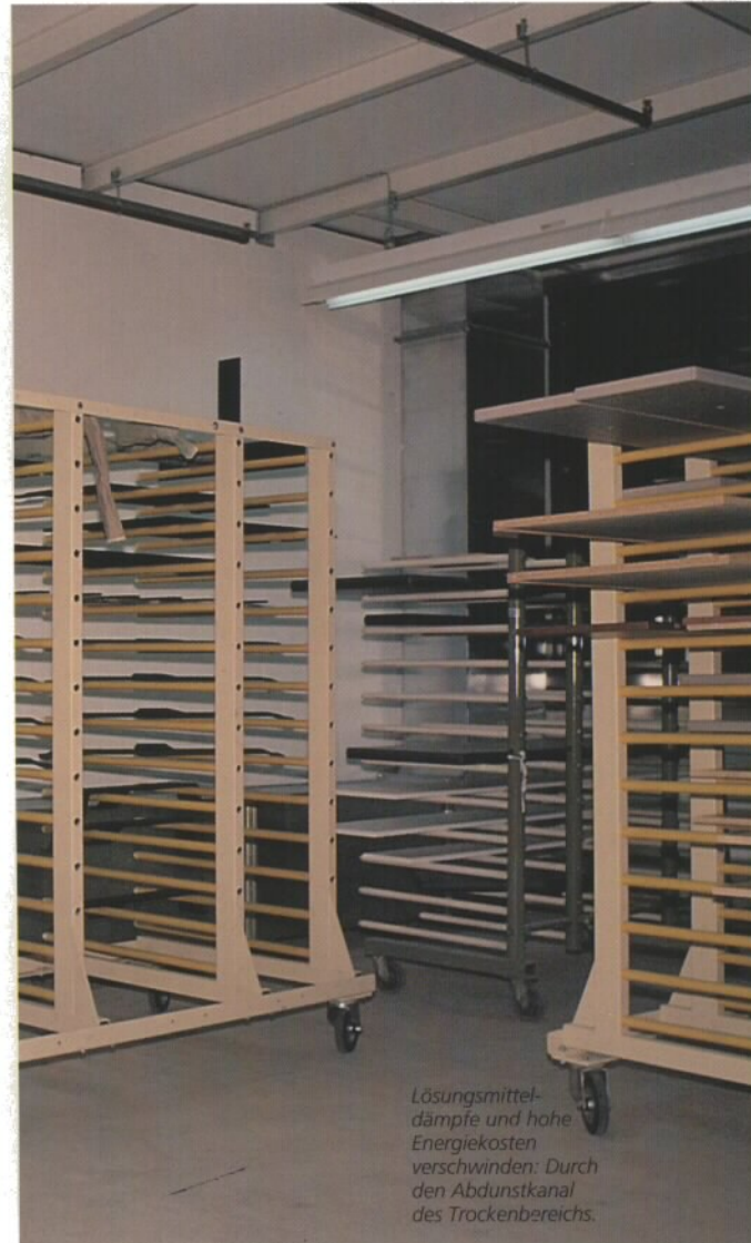
Lösungsmitteldämpfe und hohe Energiekosten verschwinden: Durch den Abdunstkanal des Trockenbereichs.

HINTER UNSEREN LÖSUNGEN STECKT DAS KNOW-HOW DER SPEZIALISTEN: WIR MACHEN OBERFLÄCHENTECHNIK. UND SONST NICHTS.